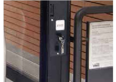
Botonera interna Steppy