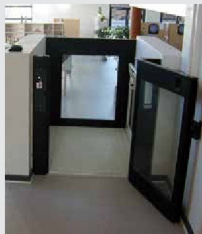
Steppy con puerta y cancela automáticas