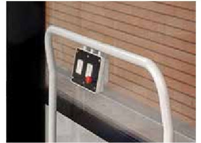
Botonera de piso Steppy

Steppy es la plataforma elevadora con soluciones técnicas y estéticas que la hacen la preferida de los instaladores italianos; mecánica hidráulica, protecciones en chapa o policarbonato gris para mejorar su design e impacto estético, mandos en máquina y pared y radiomando, hacen de Steppy una de las líderes en su segmento.